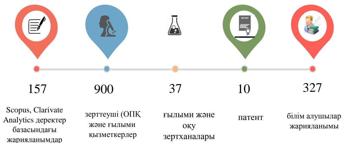
3-сурет – Ахмет Ясауи университетінің жетістіктері (2023ж.) (цифрлармен)

Ахмет Ясауи университетінің ғылыми-зерттеу және инновациялық қызметі білім, ғылым және инновацияны одан әрі интеграциялауға негізделген. Университет ғалымдары түркология, археология, дінтану, тарих, экономика, математика, физика, ақпараттық технологиялар, экология, электр энергетикасы, биотехнология, медицина және т.б. салаларда зерттеулер жүргізеді. Университеттің ғылыми портфолиосы 3-суретте көрсетілген.